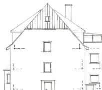
L. Baumbach Baugesellschaft mbH 37133 Friedland