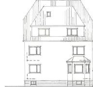
L. Baumbach Baugesellschaft mbH 37133 Friedland