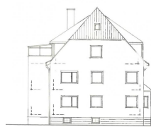
L. Baumbach Baugesellschaft mbH 37133 Friedland